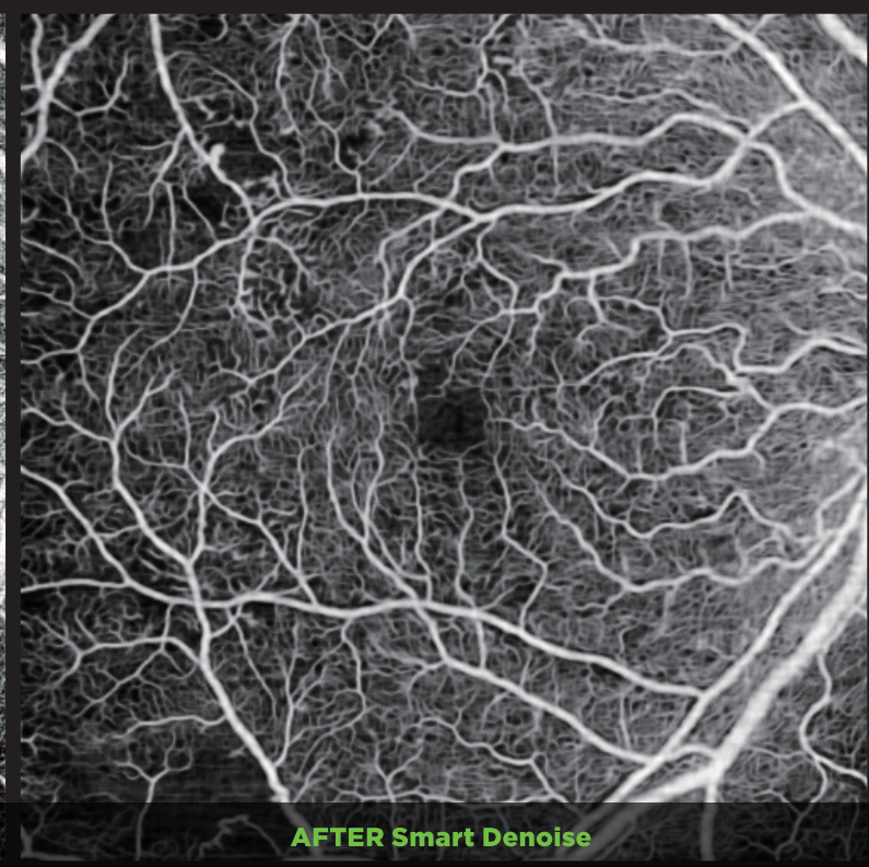
AFTER Smart Denoise